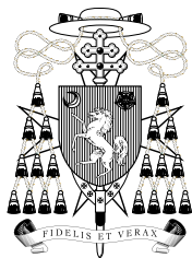
Arċidjoċesi ta' Malta