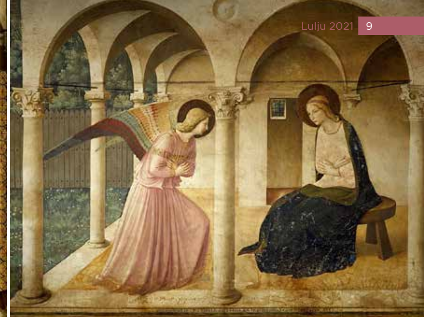
L-Annunzjazzjoni, Kunvent San Mark, Firenze

Nehhi dik it-tieqa mill-affresk, u l-impatt li ried Fra Angelico jspiċċa kollu. U l-importanza tat-tieqa mbarrata tkompli