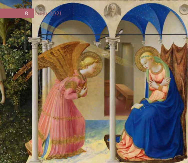
L-Annunzjazzjoni, Prado, Madrid

silenzjuż li kien għaddej bejn għajnejn Marija u għajnejn l-Anglu. Il-harsa ta' bejniethom hija fil-fatt il-qofol tal-laqgħa tagħhom. Il-kuluri żammhom taht kontroll, ħlief fil-gwienah tal-anglu.