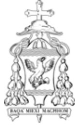
Djoċesi ta' Għawdex