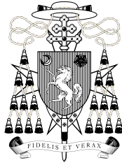
Arċidjoċesi ta' Malta