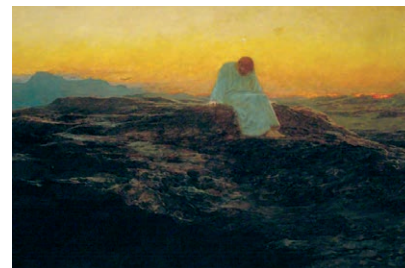
Briton Rivière - « Tentazzjoni fid-deżert »