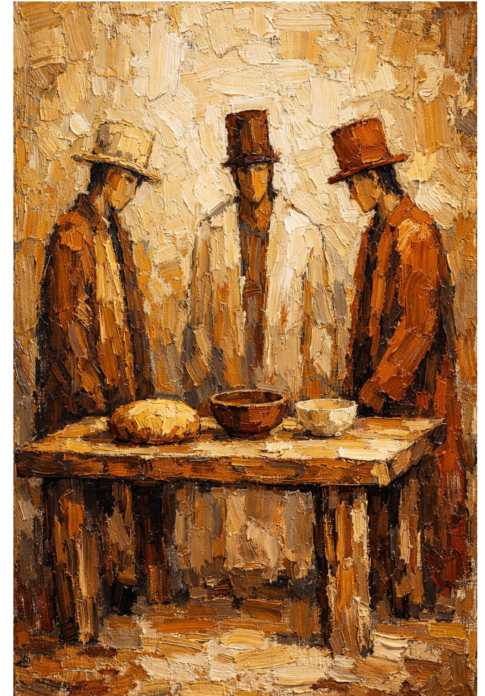
Il-ħajja ordinarja, offruta bis-sliem.

Taf x’inqu jagħmel Pawlu f’Rumani 14? Qed jitkellem fuq affarijiet ordinarji ħafna – jekk tiekol laħam jew le, jekk tosservax xi jiem speċjali jew le. Mistoqsijiet prattiċi tal-ħajja ta’ kuljum. U madankollu, moħbi f’din il-parir hemm xi ħaġa kważi li tieħu n-nifs: il-prattiċi tagħna minn barra