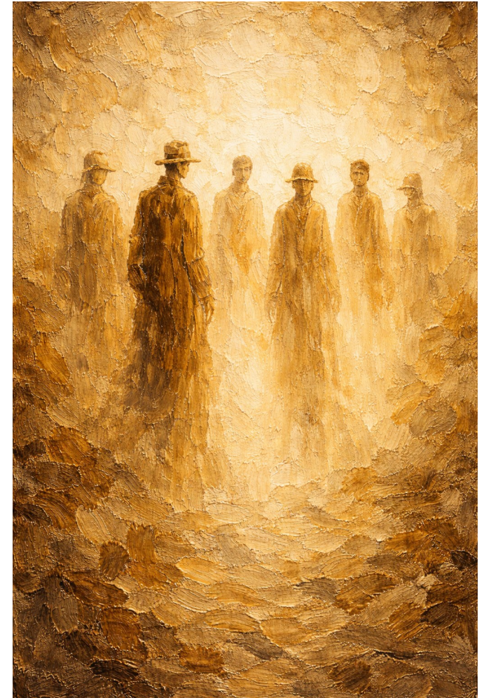
Fl-aħhar niskopru dak li dejjem kien minnu – aħna ta’ Alla.

Fit-tradizzjoni kontemplattiva Ortodossa –