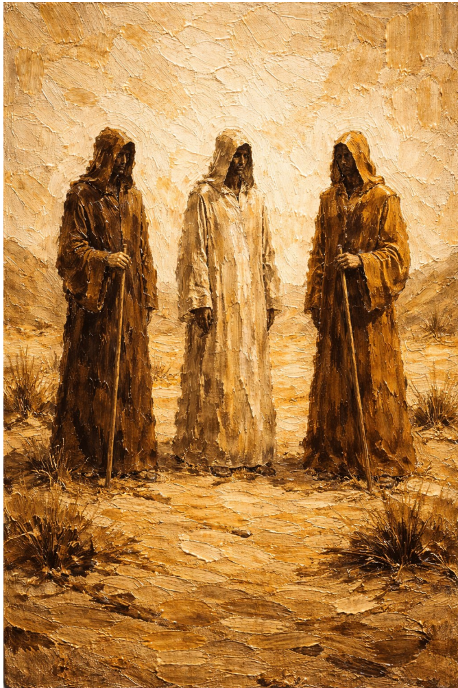
Fis-skiet tad-deżert ir-ruh titghallem toqghod quddiem Alla.

Abba Anton il-Kbir, li spiss jitqies bħala missier il-monastiċizmu, qal xi haġa straordinarjament sempliċi: