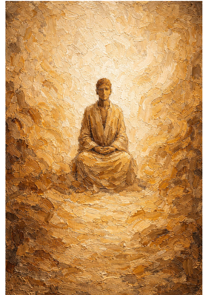
Meta l-qalb issib is-sliem, id-dinja tirtab u teħfief.